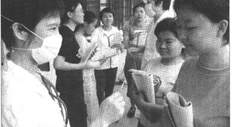
6月5日，福建省诏安县医院医护人员为即将参加高考的农村学生测量体温，了解他们的健康状况。福建省诏安县认真做好2003年高考期间的非典预防工作，密切关注考生的健康状况，并对考场进行了清扫和消毒。

高考试结束后，考生最为关注的是录取。林蕙青指出，全国高校招生录取工作今年将全面实行计算机远程异地网上录取。今年各省市区原则上不再进行集中现场阅卷网录取，各高等学校在本校或所在地利用互联网开展录取工作。