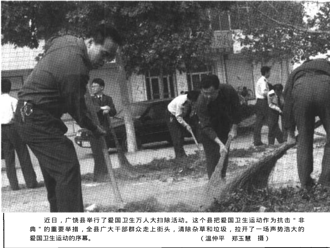
近日，广饶县举行了爱国卫生万人打扫卫生活动。这个县把爱国卫生运动作为抗击“非典”的重要举措，全县广大干部群众走上街头，清除杂草和垃圾，拉开了一场声势浩大的爱国卫生运动的序幕。