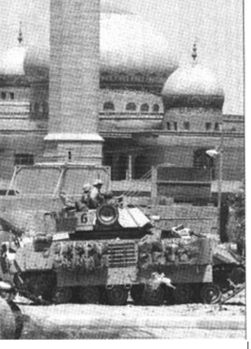
6月5日，美国士兵乘坐装甲车在伊拉克首都巴格达以西70公里处的费卢杰城巡逻。美军中央司令部当天说，一名袭击者当天用火药弹袭击了驻扎在费卢杰城的美军，至少1名美军丧生、5人受伤。