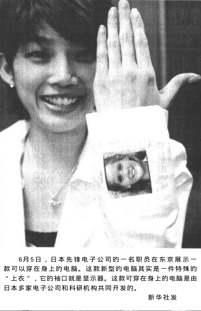
6月5日，日本先锋电子公司的一名职员在东京展示一款可以穿在身上的电脑。这款新型的电脑其实是一件特殊的“上衣”，它的袖口就是显示器。这款可穿在身上的电脑是由日本多家电子公司和科研机构共同开发的。

根据《公司法》的有关规定，经公司主管部门研究决定，依法对胜利油田河采盛熙达实业公司进行清算，请相关债权人自公告之日起90日内向公司清算组申报其债权，申报时须提供相关证明材料。联系电话：85722222 胜利油田河采盛熙达实业公司清算组