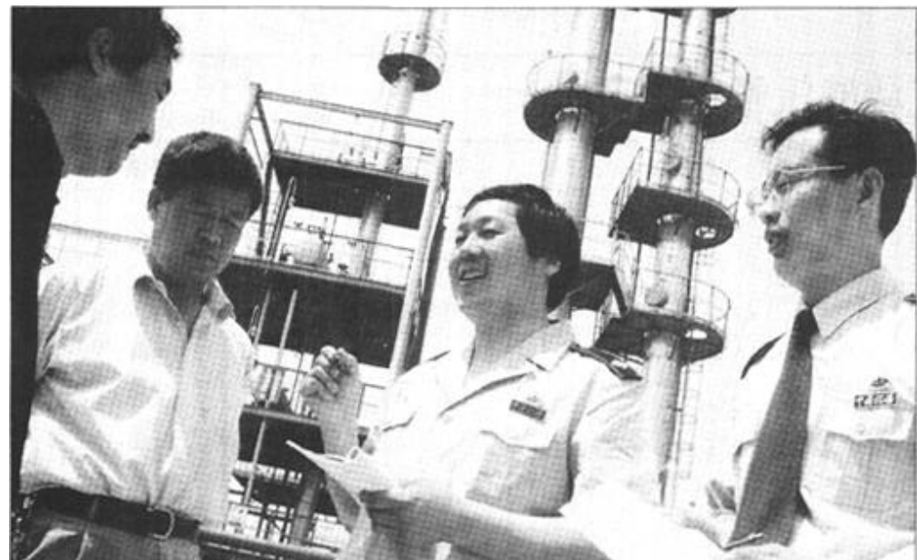
垦利县地税局在主题教育活动中,创新观念,完善机制,转变工作作风。图为工作人员在依法治税的同时,积极为企业的产品结构调整、产品促销等建言献策,为当地的经济提供优质的服务。

在连续3年保持持续快速发展的基础上,如何实现东营中行各项业务的更大飞跃,服务水平质的提高,更好地为全市招商引资工作服务?市中国银行行长栾庆禹在接受记者采访时,深有感触地说,通过对外地经验的认真学习,查找差距,我们认为归根结底就是要以思想解放为先导,加大对中小企业的支持力度。